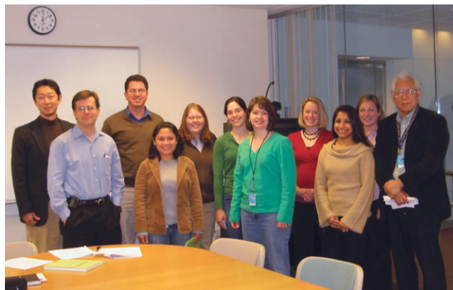
循環器医療機器審査部インターベンション機器課の仲間と

ずしも言い難いが、少なくとも選択のオプションがあるのとないのとでは大きな差がある。